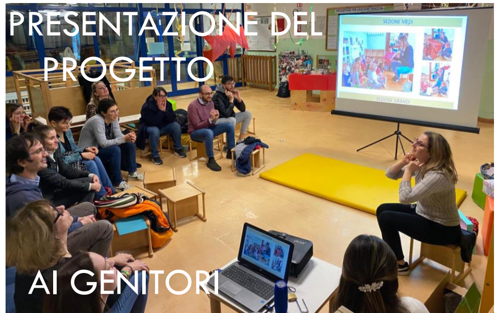
PRESENTAZIONE DEL PROGETTO